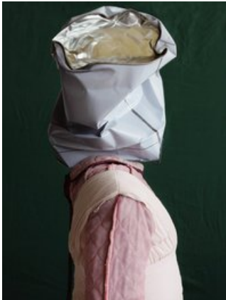
(c) Thorsten Brinkmann / Hopstreet Gallery